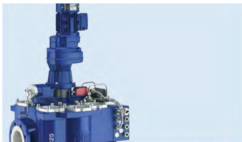
BOLLFILTER Automatic Type 6.64